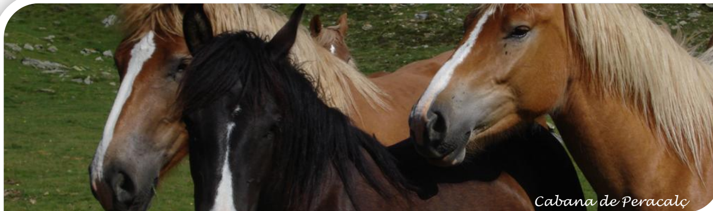
Cabana de Peracalç